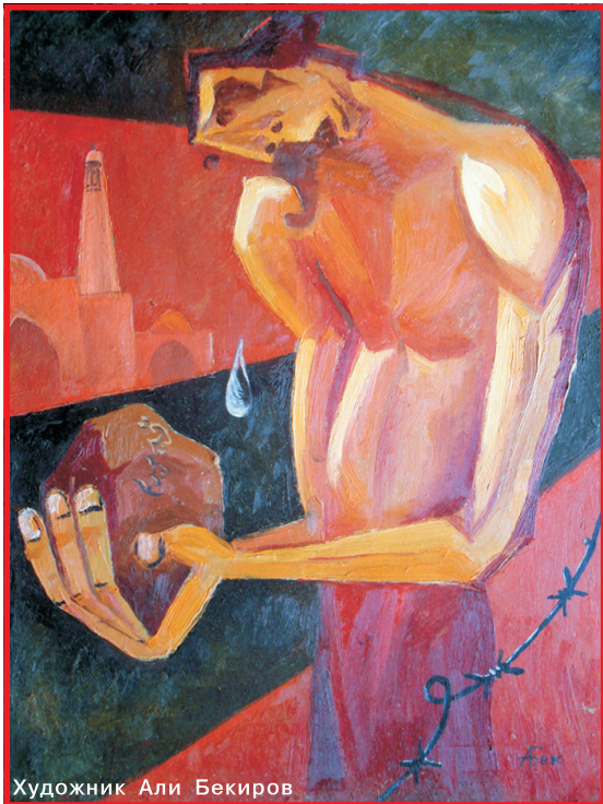
Художник Али Бекиров