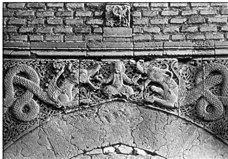
Изображение двух драконов с символом солнца между ними на городских воротах Баб-ат-Талсим (Ворота Талисмана) в Багдаде. Фото 1907 г.

Остается добавить, что бахчисарайские драконы успешно несли свой «магический караул» до 1736 г., когда на полуостров (по выражению современников событий – «словно злые духи в чистое тело Крыма») вторглись войска царского фельдмаршала Миниха. Хан Каплан I Герай перед наступлением эвакуировался из Хансарая вместе со всем двором, а российские войска заняли Бахчисарай и сожгли дворец и город. Пламя разрушительного пожара 1736 г. уничтожило легкие деревянные и фахверковые постройки Хансарая, а каменные сооружения (в том числе и нижний каменный ярус въездной башни с плитой) пострадали меньше.