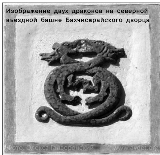
Изображение двух драконов на северной въездной башне Бахчисарайского дворца

Драконов изображали не только на постройках. Их можно встретить на брон-