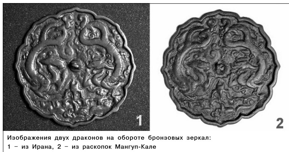
Изображения двух драконов на обороте бронзовых зеркал:

вались точки небесной сферы, в которых происходят солнечные и лунные затмения (так называемые «псевдопланеты»). Но, помимо того, пара драконов, символизирующая единство противоположностей и гармонию вселенной, наделялась также значением охранительного символа, берегущего людей от злых духов, эпидемий, нашествий врагов и прочих несчастий. Данное изображение потому так часто и встречалось при входе в общественные здания, что считалось своего рода «оберегом» для них. В свете этих аналогий достаточно проясняется и предназначение плиты, расположенной над входом в Хансарай. Но откуда же она появилась в Бахчисарае?