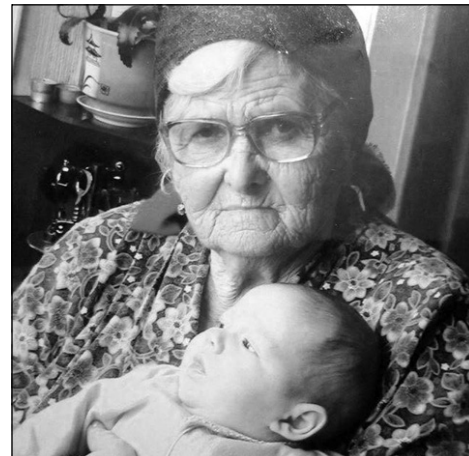
Сизни севген бала, торун ве торунчаларынъыз.

Сайгъылы, урьметли Мандражи Зера ана, къартанамызны джан-юректен 90 йыллыгынен хайырлаймыз. Даа чокъ йыллар девамьнда янымызда олмагъа, бахтлы яшамагъа Аллах насип этсин. Мераметлигинъиз, севги ве шефкъатынъыз ичюн сизге пек миннетдармыз. Аллах сизден разы олсун. Хайырлы яшлар олсун!