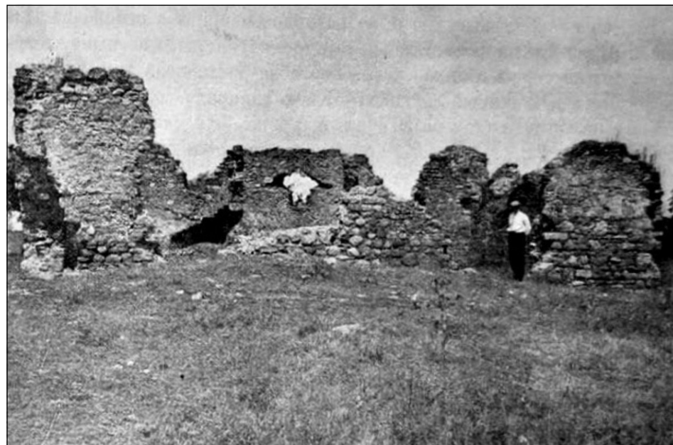
«Руины мечети, приписываемой Бейбарсу» (фотография 1920-х гг.)

ти Бейбарса» были обнаружены следы жилых построек с хозяйственными ямами, давно уже заброшенных к началу строительства мечети. Возраст этих разрушенных построек помогли определить найденные среди их руин ордынские монеты: все они относились к 14 столетию. Если бы мечеть действительно была выстроена в 13 веке, столь поздние монеты никак не могли бы попасть под ее фундамент. Эти, а также ряд других археологических свидетельств привели к выводу, что мечеть, чьи развалины мы видим сейчас, была возведена лишь в конце 14 столетия — скорее всего, при хане Тохтамыше. А заброшенный жилой квартал, на месте