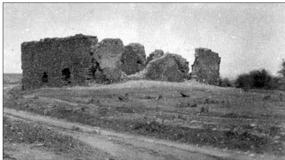
Руины мечети (фотография 1905 г.)

Итак, можно утверждать, что правильное название знакомых нам старокрымских руин — «мечеть Калауна»? Увы, нет. В 1980-х годах, когда готовилась реставрация мечети Узбек-хана, на этих развалинах были проведены археологические раскопки. Археологи, вероятно, надеялись подтвердить данные арабской хроники какими-нибудь удивительными находками. Но все оказалось гораздо прозаичнее. Раскопки показали, что фундамент мечети перекрывает собой разрушенные жилые кварталы ордынского времени. Под стенами «мече-