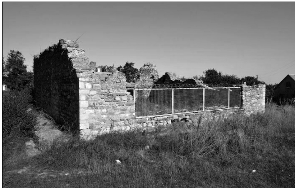
Руины мечети 14 века в Старом Крыму, называемой «Мечетью Бейбарса»

Менее, чем в двухстах метрах от знаменитой мечети Узбек-хана находятся следы древнего здания. От постройки сохранилось очень немного: лишь фундамент да нижняя часть полуразрушенных стен. Несмотря на плохую сохранность руин, они являются известной достопримечательностью Старого Крыма. Это разрушенное здание часто упоминают в журнальных статьях и туристических путеводителях под названием «мечеть Бейбарса». Во всех рассказах о ней занимает ключевое место история о правителе Египта, султани Бейбарсе, который будто бы родился простолюдином в Крыму, был продан в неволю, а затем, достигнув на чужбине власти и славы, построил в родном городе в память о себе великолепную мечеть. Именно ее остатки, как утверждают гиды, мы сегодня и видим в Старом Крыму.