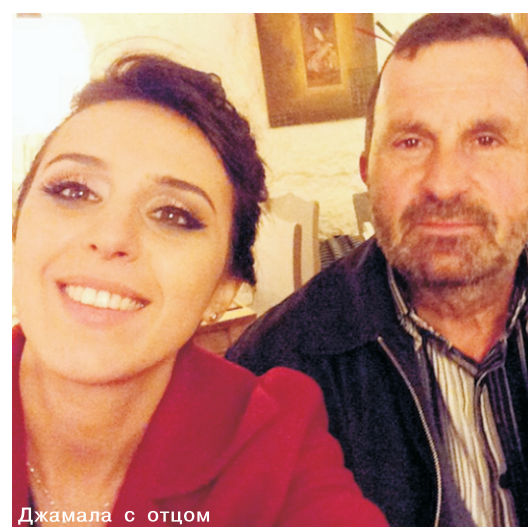
Джамала с отцом