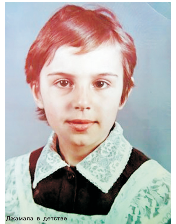
Джамала в детстве