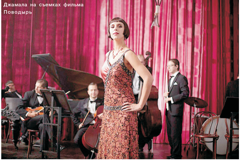
Джамала на съемках фильма «Поводырь»