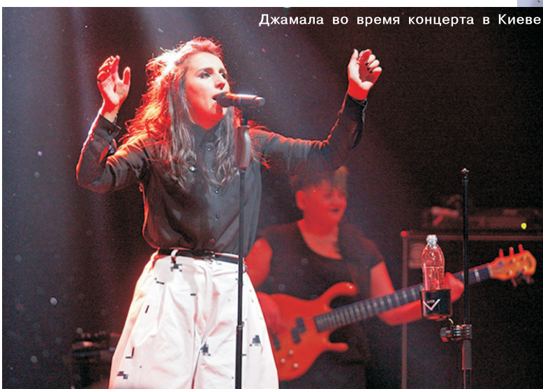
Джамала во время концерта в Киеве