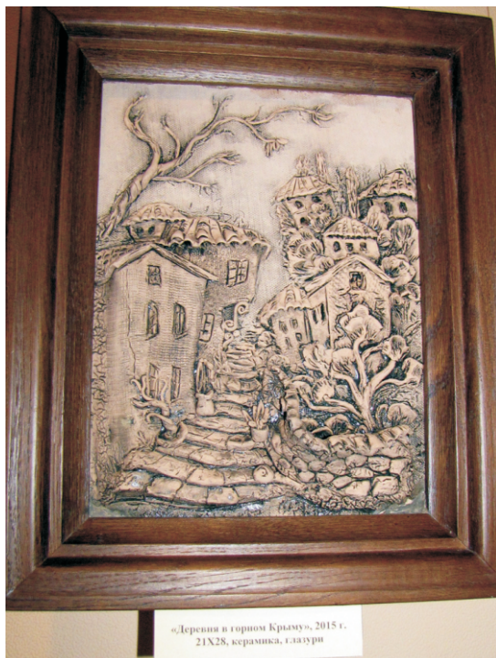
«Деревня в горах Крыма», 2015 г., 21X28, керамика, г.лазурь