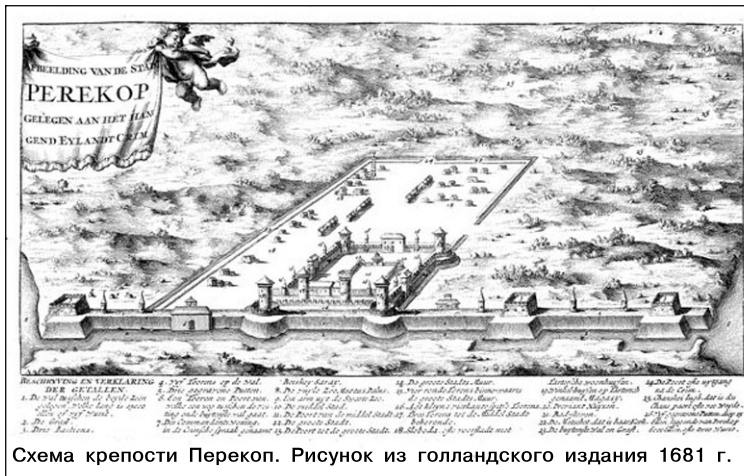
Схема крепости Перекоп. Рисунок из голландского издания 1681 г.