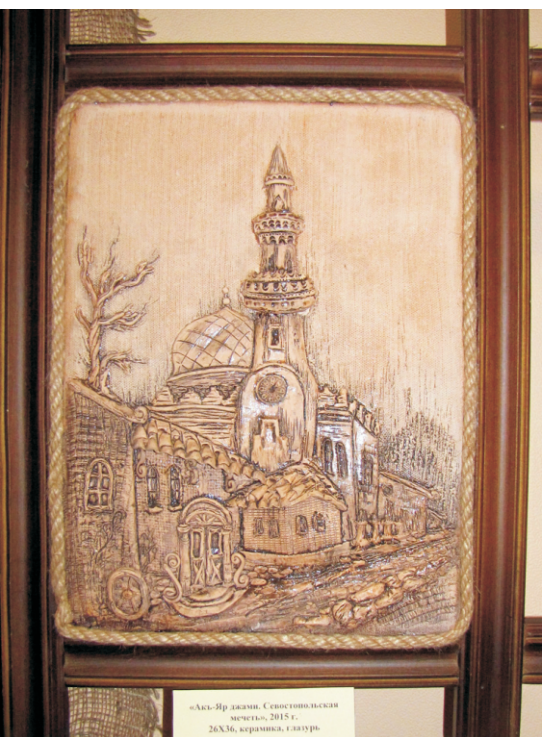
«Акс-Йр джаме, Севастопольская часть», 2015 г., 26X36, керамика, г.лазурь