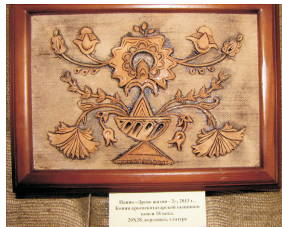
Панно «Арсно джани - 2», 2013 г., Копия крымскотатарской вышивки класи 18 века. 28X28, керамика, г.лазурь