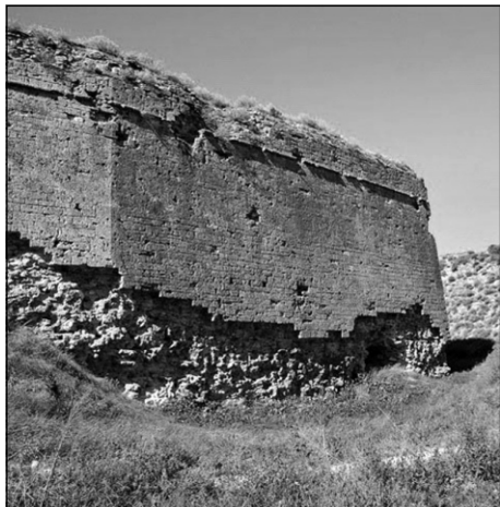
Черноморский бастион крепости Ор-Капы

схваток между теми, кто упорно пробивался в Крым, и теми, кто отчаянно удерживал его. Это были самые кровавые схватки за всю историю укреплений на перешейке: число солдат, погибших здесь во время гражданской и второй мировой войн, исчисляется десятками тысяч человек, а земля да сих пор густо засеяна пулями, осколками снарядов и даже неразорвавшимися минами. Когда в 1960-х годах по перешейку прокладывали Северо-Крымский канал, перед колонной бульдозеров и экскаваторов двигался отряд саперов, и работы им тогда нашлось немало.