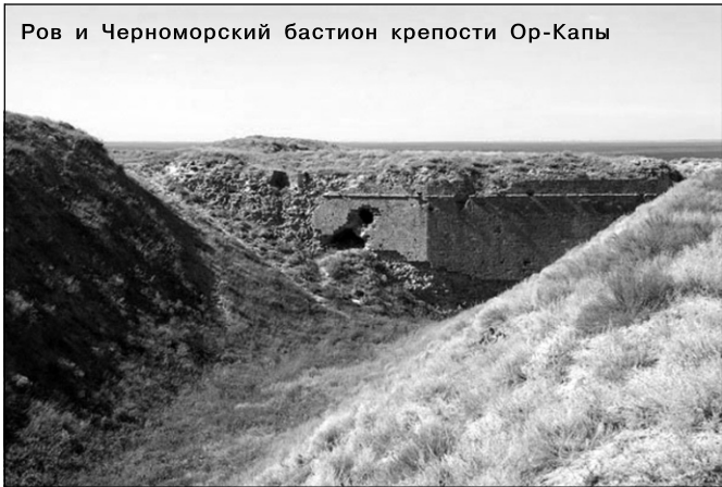
Ров и Черноморский бастион крепости Ор-Капы

При Российской империи крепость утратила былое военное значение и ее руины были постепенно разобраны на строительные материалы. Однако Перекопский ров еще не раз становился свидетелем ожесточенных