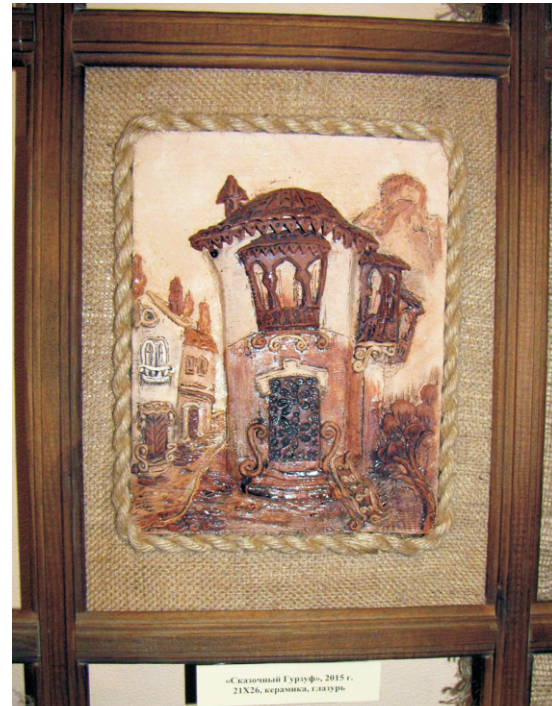
«Султанский гарем», 2015 г., 21X26, керамика, г.лазурь