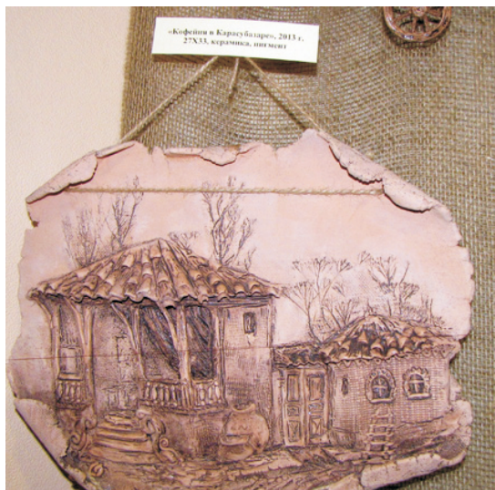
«Кюфехана в Карас-басар», 2013 г., 27X33, керамика, г.лазурь