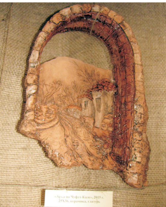
«Арш на 'Юфут-Кале», 2015 г., 25X36, керамика, г.лазурь