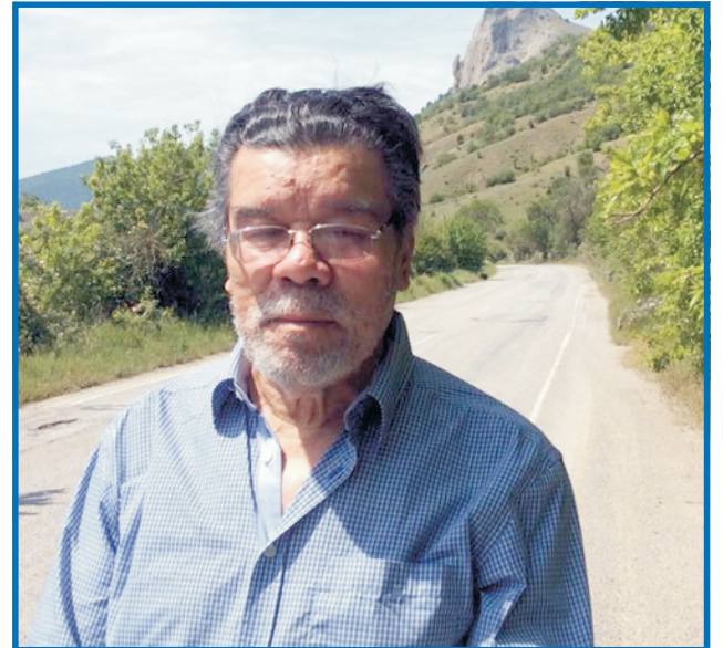
Ступенька за ступенькой, спускаясь из «башни из слоновой кости», я

миром помочь братьям» жительница Башкирии, этническая русская, в годы войны бывшая в Узбекистане в эвакуации, написала: «Только представитель благородного народа может так сочувствовать горю другого народа. Спасибо Узбекистану!»