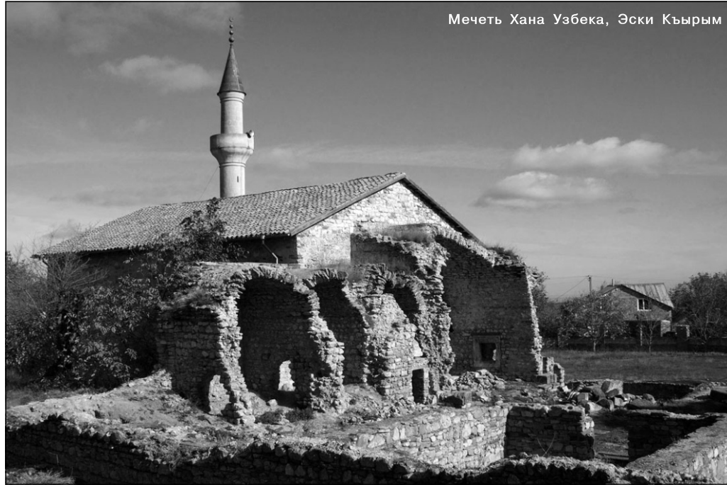
Мечеть Хана Узбека, Эски Къырым

Особое внимание в мечети уделяется образовательному процессу. Ведь именно правильное преподнесение религиозных постулатов, связанных с личной и общественной жизнью человека, позволяет развивать ту искренность, которая требуется не только для совершения богослужений, но и для пристального ухода за самим сооружением. В мечетях могут быть организованы уроки по чтению Корана, ознакомлению с принципами Ислама, прослушивание полезных проповедей, как для старшего поколения, так и для молодежи. Чем больше будет интенсивности в развитии и деятельности мечети, тем больший авторитет она обретет не только среди прихожан, но и среди тех, кто, казалось бы, мало уделяет внимания ее благоустройству. В истории мусульманских народностей мечеть в большинстве случаев играла определяющую роль в жизни общества и даже для разрешения каких-то массовых конфликтов люди собирались в мечетях для того, чтобы найти выход из сложившейся проблемы. Это, в принципе, естественно, так как