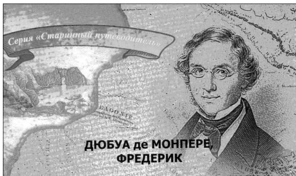
ДЮБУА ДЕ МОНПЕРЕ, ФРЕДЕРИК

* По книге: Дюбуа де Монпере Фредерик. Путешествие в Крым. В переводе с французского публикуется впервые. [Перевод с французского, предисловие и примечания к.и.н. Тимофеевой Т.М.]. – Симферополь: Бизнес-Информ. – 2009. – 328 с.