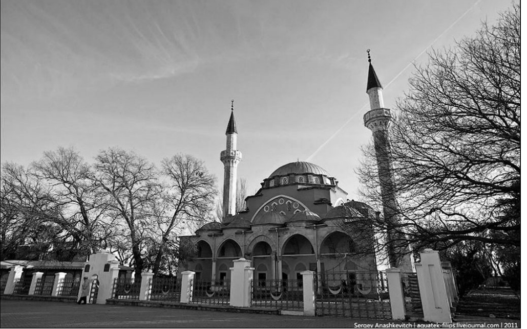
Хан Джамии. Кезлев

нием отнесется к существованию такого сооружения, как мечеть, будет уделять какой-то промежуток времени его развитию, особенно если это касается проведения каких-либо массовых мероприятий, посвященных определенному событию.