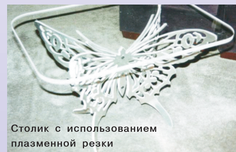
Столик с использованием плазменной резки

ренности», – добавляет герой рубрики. Как правило, частные работы занимают порядка одной полной недели и причастности двух людей, на изготовление ответственных работ требуется, конечно же, больше времени и рабочих рук.