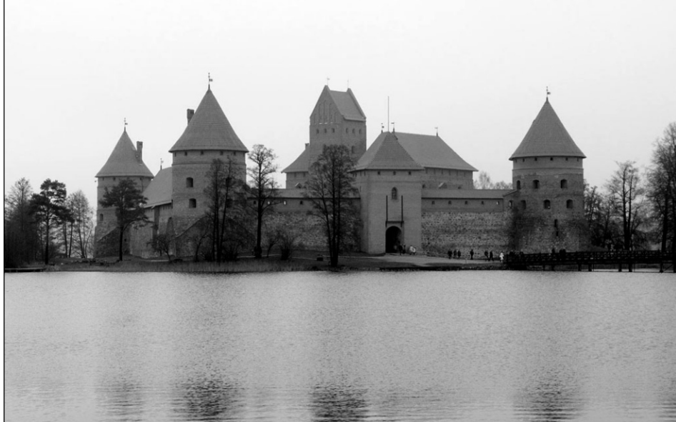
Замок Троки, здесь родился крымский хан Хаджи Гирай

империи Чингисидов. Это не могло не отразиться на Крымском юрте и во второй половине XIV века: на время был отстранен от власти род Уран-Тимура. Но в 1395 году наследник крымских эмиров Таш-Тимур восстановил не только свои права, он провозгласил себя самостоятельным ханом Крымского юрта. Это означало, что он больше не намерен, пусть и номинально, но подчиняться сарайским ханам.