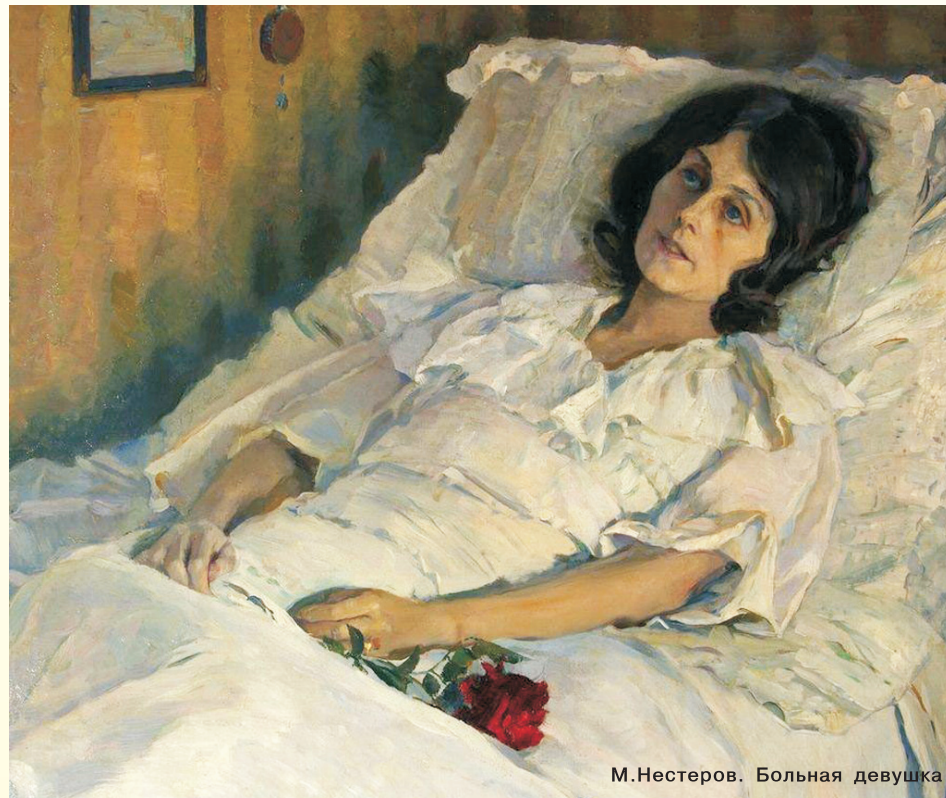
М.Нестеров. Больная девушка