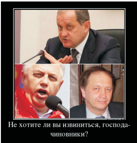
Не хотите ли вы извиниться, господа-чиновники?

История – наш учитель. События повторяются, люди не меняются, каждый ошибается, а извиняются лишь сильные. Эту мудрость постигли почти во всем мире.