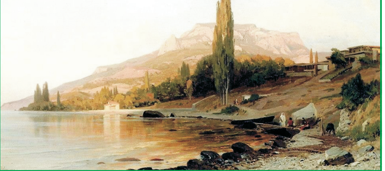
Орловский В.Д. «Вечер на морском берегу», 1870 г.

Старик ответил: «Ей было всего пять лет, а тебе двенадцать, когда совместно с твоим отцом, который на протяжении пятидесяти лет был мне почти как брат, мы задумали вас поженить. Вот уже двенадцать лет, как нет твоего отца, но его воля и память о нем священны для меня. Ты можешь отправляться со спокойной душой... Возьми в дорогу эти десять рублей и пусть Аллах бережет тебя!..»