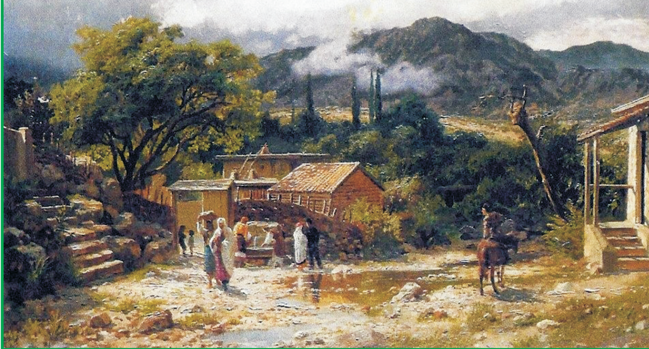
Киселев А.А. «В горном ауле», 1864 г.

ниже ростом, вставали на носки и, вытянув шею, махали руками в надежде обратить на себя внимание. Лишь один из них оставался молчаливым. Он сидел в сторонке напротив маленькой террасы. Опершись двумя руками на длинный черенок лопаты и подперев ими свой подбородок, он, кажется, был очень далек от всего происходящего вокруг него; его взгляд был прикован к решетке маленького окна, за которым Сайме располагалась таким образом, что только он один