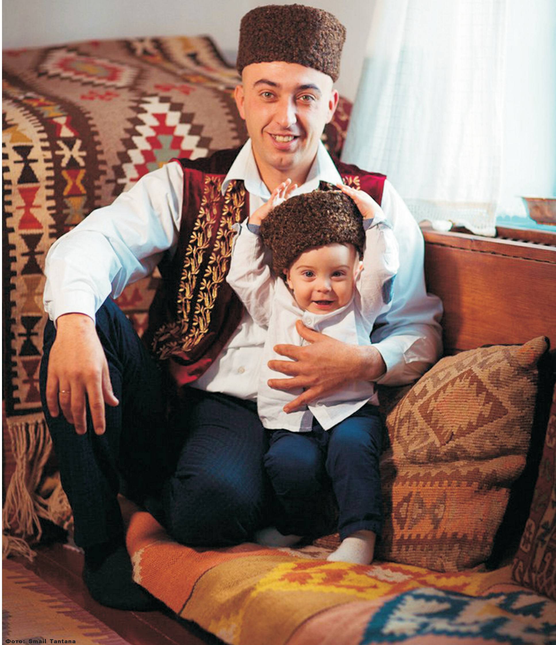
Фото: Smail Tantara