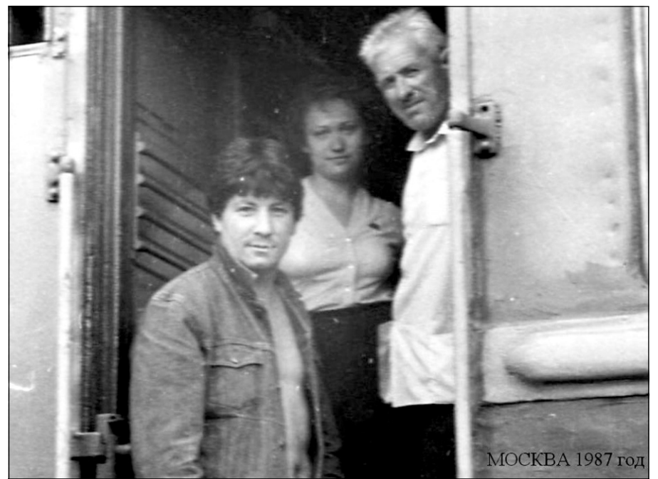
МОСКВА 1987 год