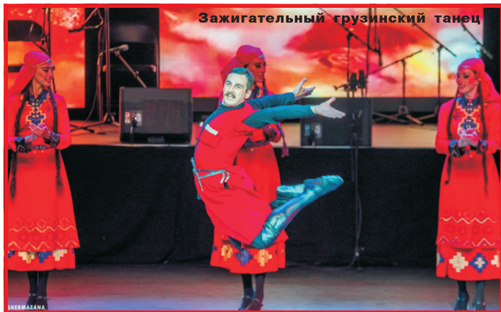
Зажигательный грузинский танец