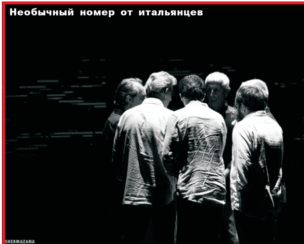
Необычный номер от итальянцев

регу моря, который поразил меня своим необыкновенным колоритом. Здесь мы ощутили синергию современного типа жизнедеятельности общества и древних традиций. Во второй день мы переехали в город Уреки. А на третий день нам выпала честь выступать в новом концертном зале «Black Sea Arena», который расположен в поселке Шекветили. Хочется отметить, что это был один из самых прекрасных залов, в которых я когда-либо выступала. Он рассчитан на 8