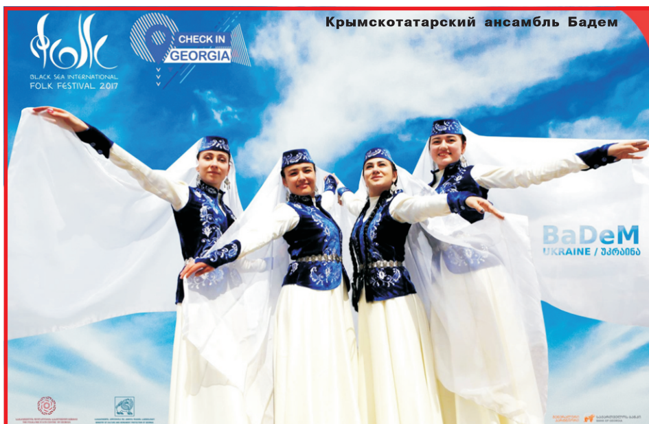
Крымскотатарский ансамбль Бадем

– Из-за того, что программа была насыщена выступлениями, мы бы физически не сумели что-то посмотреть. Но во время путешествий между городами мы успели увидеть изумительную природу Грузии. Одновременно мы убедились, как привет-