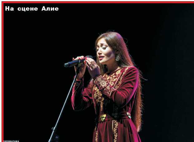
На сцене Алие