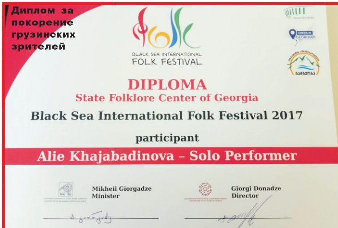
Диплом за покорение грузинских зрителей