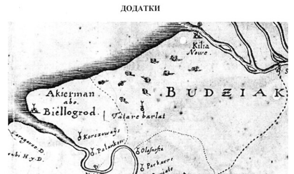
1. Фрагмент «Карта Украины» Г.Боплана (1648).

жаке, и попытался привести Буджак в подданство Османской империи. Однако формально османские власти не смогли подчинить себе своевольных буджакцев, которые до последнего лелеяли надежду вновь возвести на трон своего хана — Шагина Гирая.