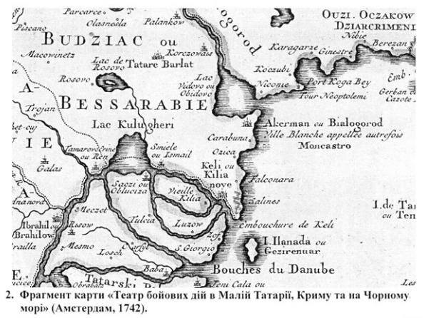
2. Фрагмент карты «Театр боевых действий в Малой Татарии, Крыму та на Чорному морі» (Амстердам, 1742).

И если бы это не получилось в Бахчисарае, они готовы были образовать новое Крымское ханство со столицей в Буджаке и во главе с Шагином Гираем. А все, потому что во второй половине 60-х годов XVIII века, тогда еще молодой принц Шагин Гирай был сераскиром в Буджаке. Именно тогда он сумел завоевать доверие и расположить к своей персоне местных татар.