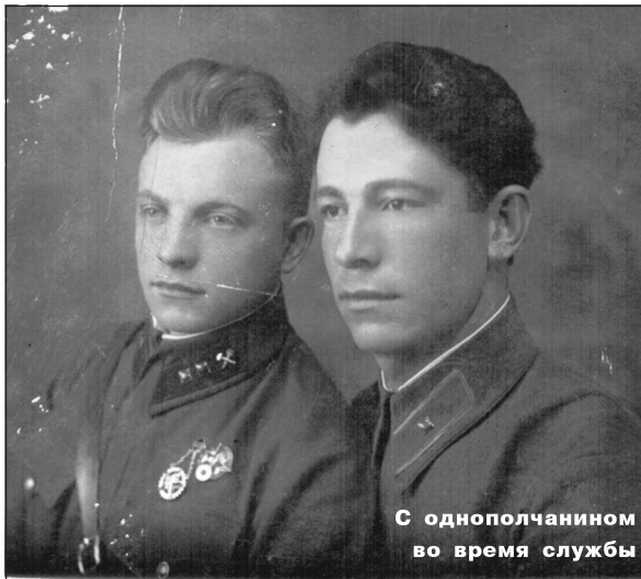
С однополчанином во время службы

В нем было много бывших военнопленных различных национальностей. Был среди них, кроме Эннана-агъа, еще один