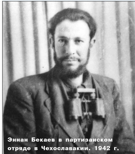
Эннан Бекаев в партизанском отряде в Чехословакии. 1942 г.

альность агронома. Далее поступил в высшую военную школу в Москве. С началом войны был призван офицером на фронт. В 1942 году попал в плен. Он с сослуживцами два раза пытался бежать из плена. Первый раз их поймали и вернули. Беглецов преследовали с овчарками, и они были сильно покусаны. После первого побега их перевели в лагерь на территории Чехословакии. Как вспоминал Эннан-агъа, в лагере был военнопленный француз, врач по специальнос-