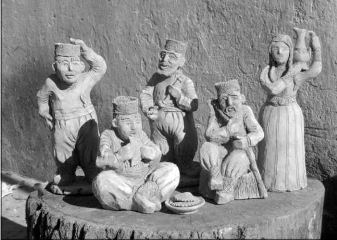
Работа Ризы Абдуземля

ти себя в соответствии с обстоятельствами, и при этом все пронизано национальным духом, колоритом прекрасной земли, именуемой Крымом.