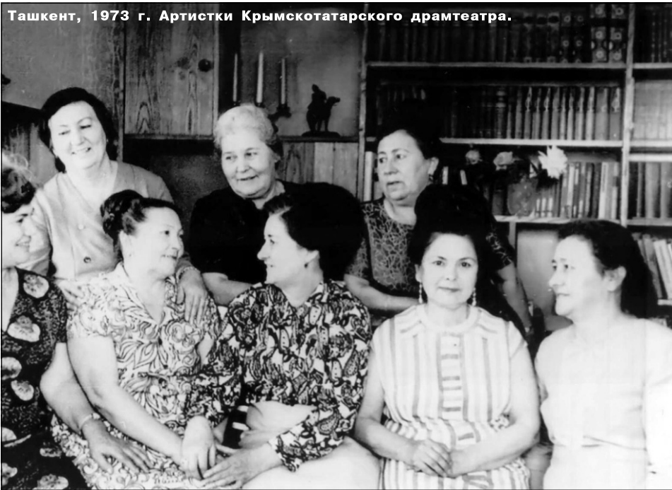
Ташкент, 1973 г. Артистки Крымскотатарского драмтеатра.