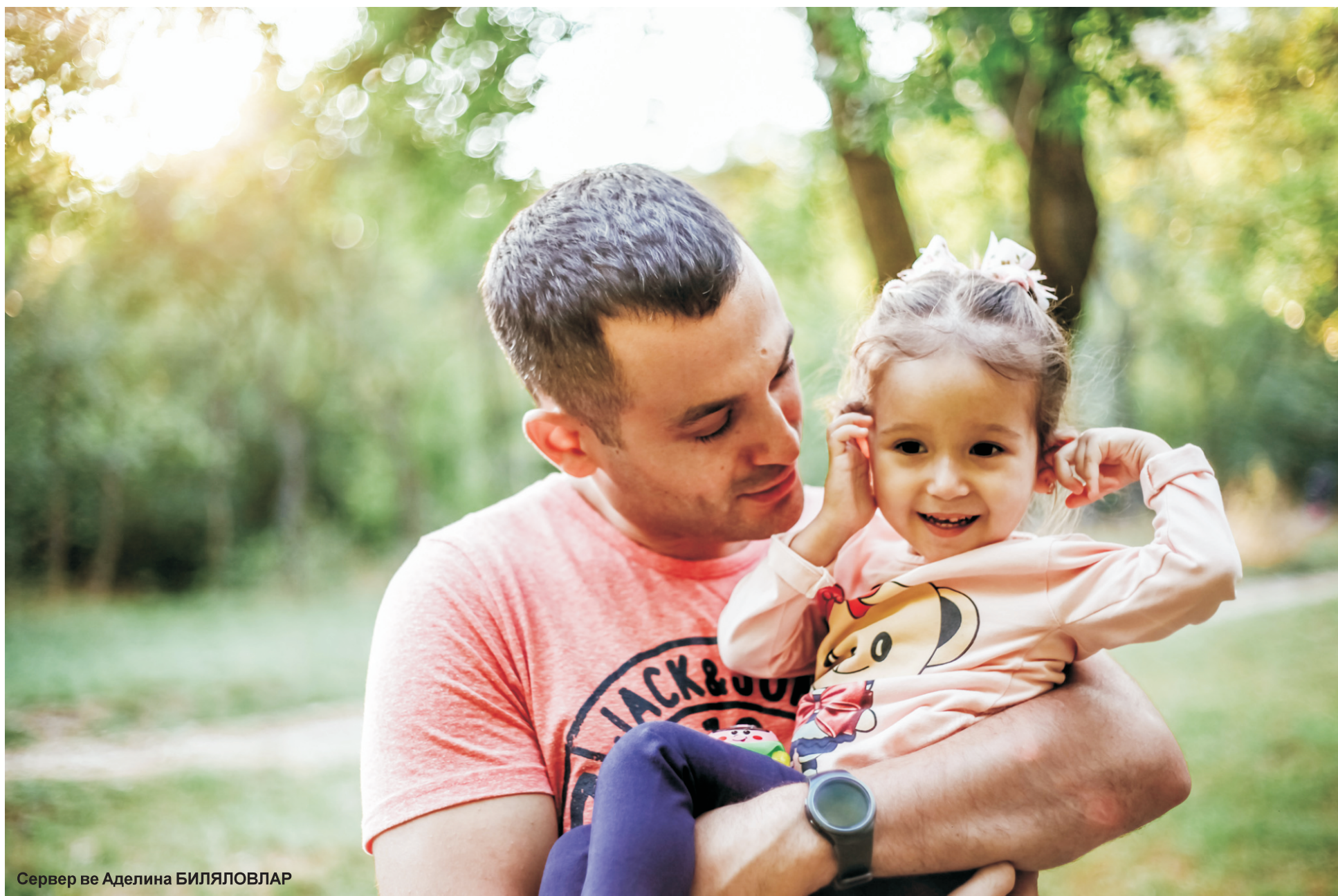
Сервер ве Аделина БИЛЯЛОВЛАР

Я не перестану переживать за твою судьбу, сколько бы лет ни прошло. Ты только будь характером как твоя мать. Она лучшая и лучшее для нас с тобой.